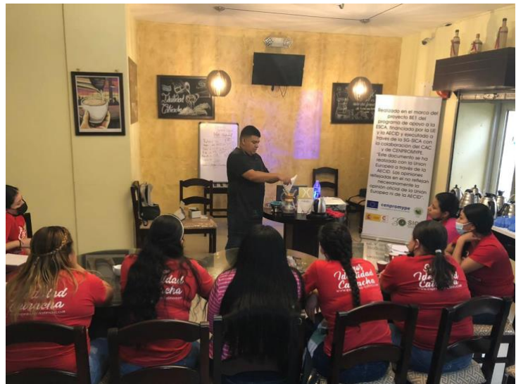
Proceso de asesoría técnica en una de las cafeterías impulsadas por el Fondo Regional

Detrás de cada una de las 72 empresas beneficiarias hay muchas familias compartiendo una historia de resiliencia y perseverancia, impulsando la reactivación económica de sus 14 municipios, fortaleciendo sus capacidades a pesar de la crisis y aportando desarrollo del tejido productivo y social en sus territorios, y por extensión en la región centroamericana.