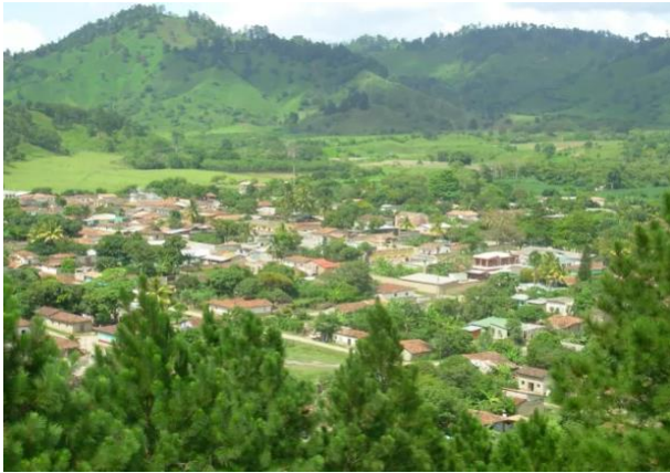
Municipio de Los Trojes, Honduras

Trojes es un municipio fronterizo del departamento de El Paraíso, Honduras y se caracteriza por ser una región ganadera y de producción de lácteos. En la zona de arenales, prolifera la producción de granos básicos y existen plantas procesadoras de rosquillas, hojaldras y quesadillas. También existen varios productores/as de miel que brindan un producto de excelente calidad porque el clima así lo permite.