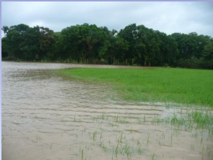
Exceso de lluvia, inundaciones